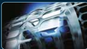
Scharfe Klingen mit einem Schneidewinkel von 30°