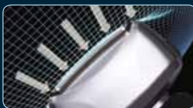
Scherkopf mit bogenförmiger Scherfolie